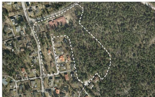
Flygfoto över detaljplaneområdet.