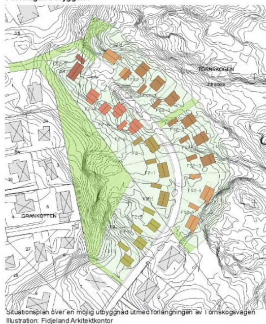
Illustration över tänkt utbyggnad av Törnaskogsvägen

Samtliga handlingar finns tillgängliga på kommunens hemsida.